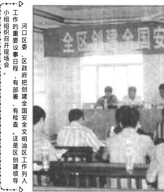
河口区委、区政府把创建全国安全文明油区列入重要议事日程，有部署、有检查。这是区创建工作列入小组会议现场会。

稳定文明的油区秩序，融洽无间的油地关系，良好的发展空间，为河口区区域经济发展奠定了坚实的基础。1998年，全区经济和各项社会事业建设都取得了喜人成就，工农业总产值达到7.94亿元，同比增长42.5%，完成财政收入10206万元，增长14.3%，农民人均纯收入达到2303元，增收557元，增长31.9%。