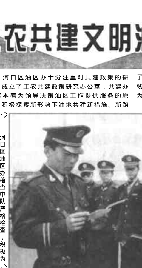
河口区油区办稽查中队严格检查，积极为油田生产建设保驾护航。

河口区油区办十分注重对共建政策的研究，成立了工农共建政策研究办公室，共建办公室本着为领导决策油区工作提供服务的原则，积极探索新形势下油地共建新措施、新路子。搜集信息130余条，积极为共建单位牵线搭桥60余次，真正发挥了桥梁纽带作用，为企地共建、振兴区域经济发展做出了积极贡献。