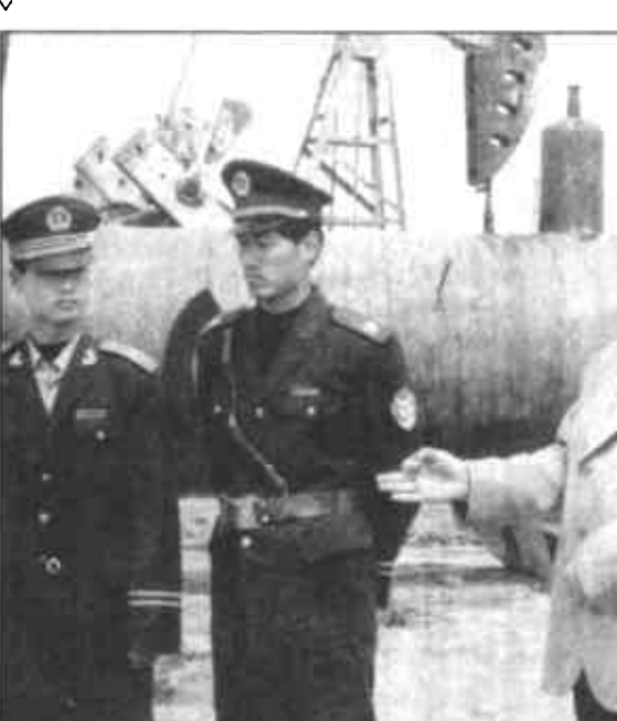
河口区公安分局以创建全国文明油区为载体，以油区治安为重点，充分发挥治安联防大队及派出所、警务区的作用，全区油区治安防范得到进一步加强，为创建全国安全文明油区以及河口区油地经济、社会各项事业发展创造了良好的社会治安环境。

河口区油区工作办公室成立于1988年，多年来，河口区油区办高举“团结、开发、建设”的旗帜，积极协调油地工农关系，加强和促进油地结合，维护油区秩序，为油田生产建设保驾护航，促进地方经济发展。河口区油区办在区委、区政府及上级业务部门的正确领导下，紧紧围绕工作职责开展各项油区工作，积极为油田生产建设提供优质服务、排忧解难。同时立足于自身工作职责，注重做好结合文章，促进了共建文明油区活动的开展。 多年来，河口区油区办先后与油田驻河口有关单位建立了定期联络制度，每季度召开一次例会，联合办公，互通有无，及时了解油田生产、生活状况，认真落实油田部门提出的建议或意见，相互促进、共兴共荣。近年来，河口区油区办多次协调召开了油田地方领导联席会议和各种形式的工农座谈会，走访油田单位600余次，双方对企地结合、油区治安等问题经常进行广泛深入的探讨和交流，达成了共识，形成了合力。河口区油区办坚持把企地共建、互惠互利、优势互补、风险共担作为油地寻求发展与合作的原则和基础。油地之间的联手共建为地方经济发展产生了深远影响。长期以来河口区油区办致力于共建领域的研究和实践，通过创建全国安全文明油区活动的深入开展，与驻河口各油田单位达成了共识，在共建方面取得了可喜成绩，现已巩固具有良好效益的共建对子22个、促成PVC二期工程、“城建年”活动、环城水系建设等一批油地共建项目。在全区机关干部领办办工程施工中，河口区油区办走共建路子，向油田有关单位求援，得到了油田单位的大力支持和援助。