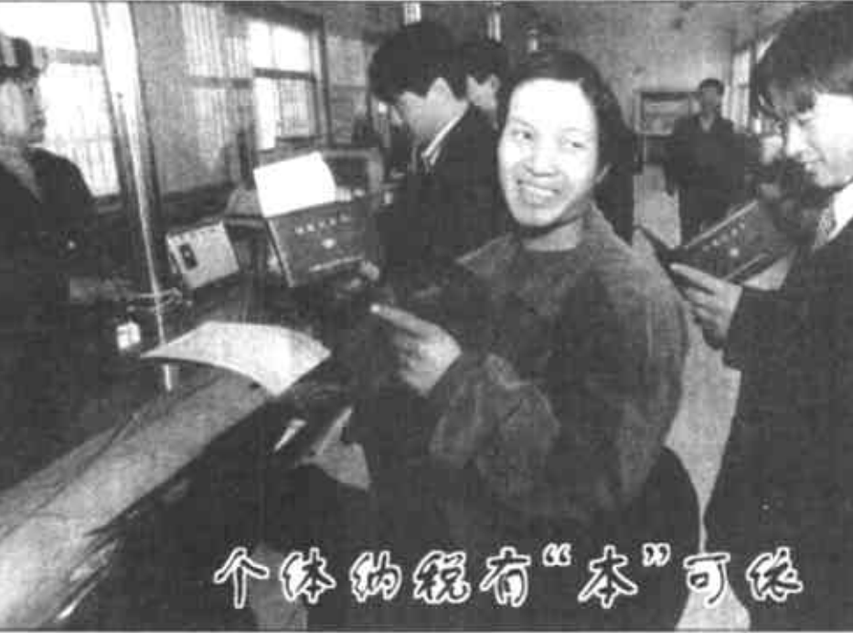
个体的经营有“本”可依

征收。对个人所得税、营业税、投向税等实行单下任务、单独考核;对企业所得税依靠社会综合治税的力量,开展专项治理,做到齐抓共管,应征不漏;严厉打击偷、漏税和抗税行为,加强对欠税的清理,做到应收尽收。县财政局注重“养鸡下蛋”,多方筹集资金,扶持县域企业和个体私营经济的发展,培植壮大了财源。同时,抓好非税性收入,采取源头控制和票证制约“双管齐下”的办法,重点抓了行政性收费、罚没收入等资金的管理入库,保证了非税收的进度。(吴国良 程群英 徐宝武)